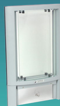
Duetto avec volet de transfert